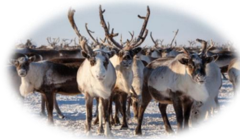
Республика Саха (Якутия)