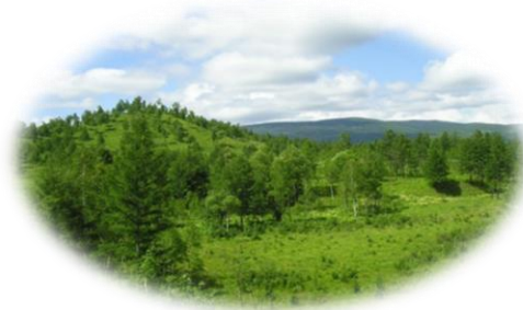
Еврейская автономная область